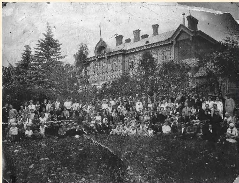
Лимонадный завод в 1930-х гг.

Лимонадный завод до сих пор не даёт покоя почитателям и ревнителям Дудергофа.